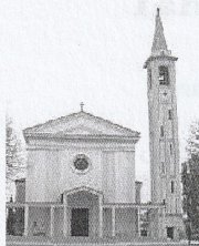
SANTA MARGHERITA V.M. - TAMAI