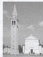
SAN MICHELE ARCANGELO - MARON